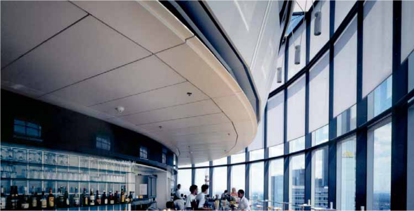
Main Tower, Francfort