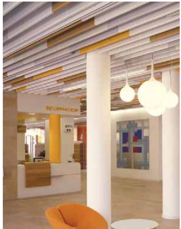
Volksbank Raiffeisenbank, Dachau

Nuestro amplio know how, nuestra larga experiencia y el asesoramiento personal durante todo el transcurso del proyecto, permite la realización de sus proyectos incluso con soluciones especiales individuales – siempre como usted se lo imagina.