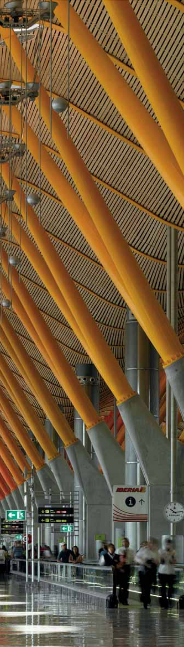
Aeropuerto Internacional de Barajas, Madrid Arquitectos: Rogers Stirk Harbour + Partners, Estudio Lamela