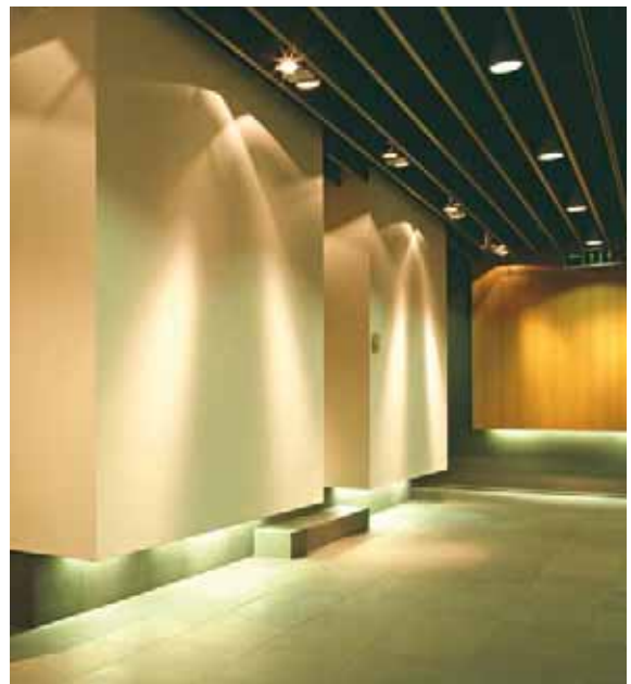
Lufthansa First Class Lounge, Francfort Diseño: Hollin + Radoske Architects