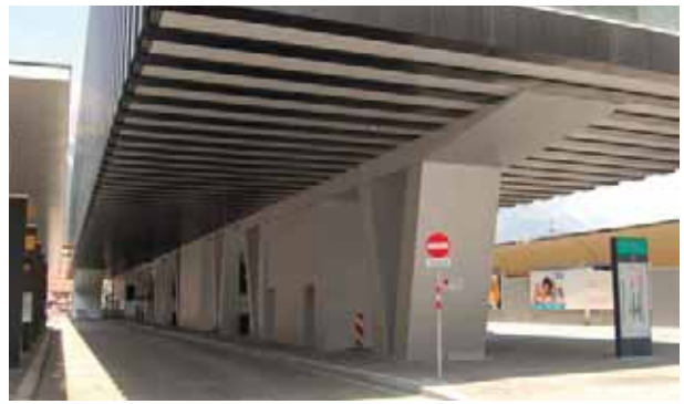
Hotel am Bahnhof, Innsbruck

Nuestra gestión integrada de proyectos garantiza un montaje óptimo de sus soluciones, incluso en grandes proyectos internacionales.