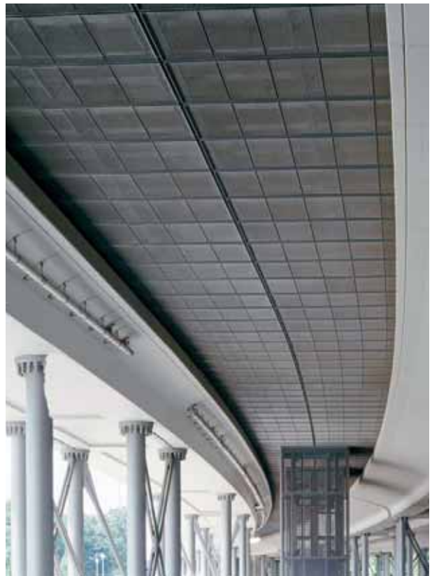
Hotel am Bahnhof, Innsbruck

En este sentido, nuestro servicio abarca las áreas de control de calidad, logística, aprovisionamiento y almacenaje, control de finanzas y evolución del proyecto, así como aspectos relativos a cuestiones de seguridad y salud.