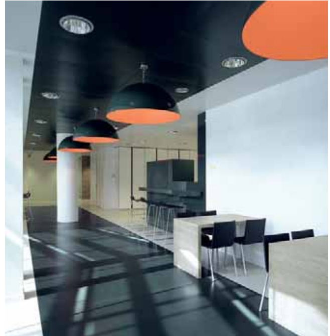
Woonzorg, Países Bajos