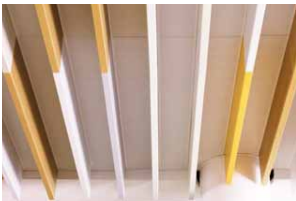
Volksbank Raiffeisenbank, Dachau

Para lograr una atmósfera natural en sus espacios, también suministramos nuestros techos metálicos con diferentes revestimientos decorativos de madera. Aquí puede ver nuestros acabados en madera „ARTline“ con revestimiento de polvo especial. La superficie es resistente a los rayos ultravioletas y ofrece una elevada resistencia contra disolventes y productos químicos.